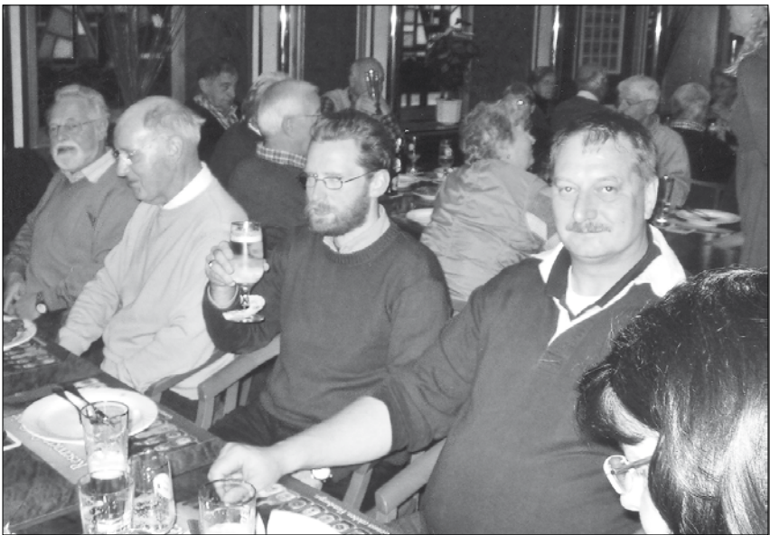
... eine reichhaltige Verköstigung. Na, dann: „Plop“ und Prost!