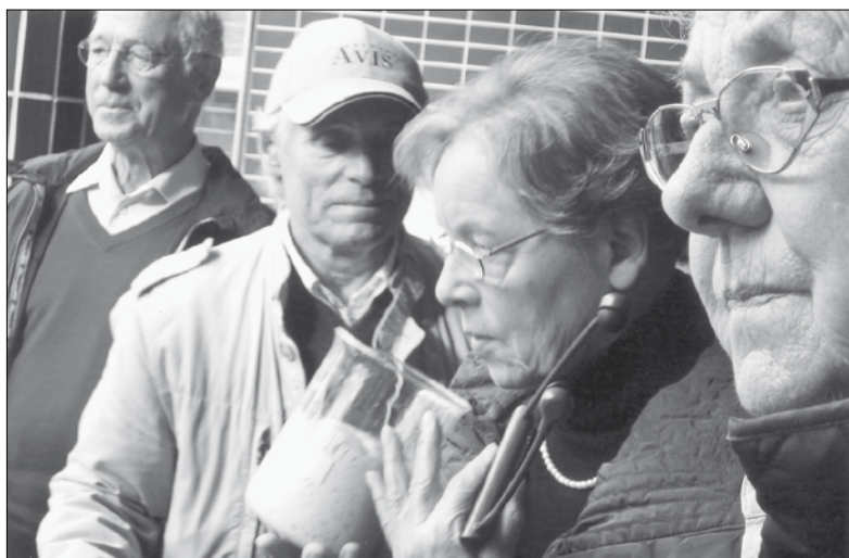
Vielfältige Geruchswelten erfüllten die Luft: Hopfen, Malz und Bierhefe