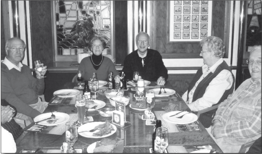
Nach Brauhaus, Abfüllung und Lager folgte in geselliger Runde ...